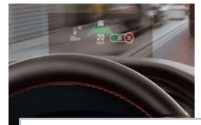
Projekcijski zaslon Head up