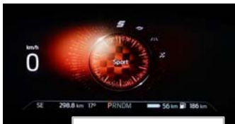
Izbira voznega načina