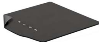
Obojestranski tepih za prtijažni prostor